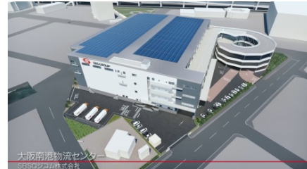
上空から南港物流センターへズームイン