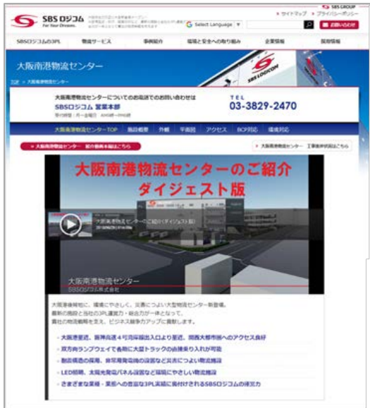
【大阪南港物流センター特設ページトップ】