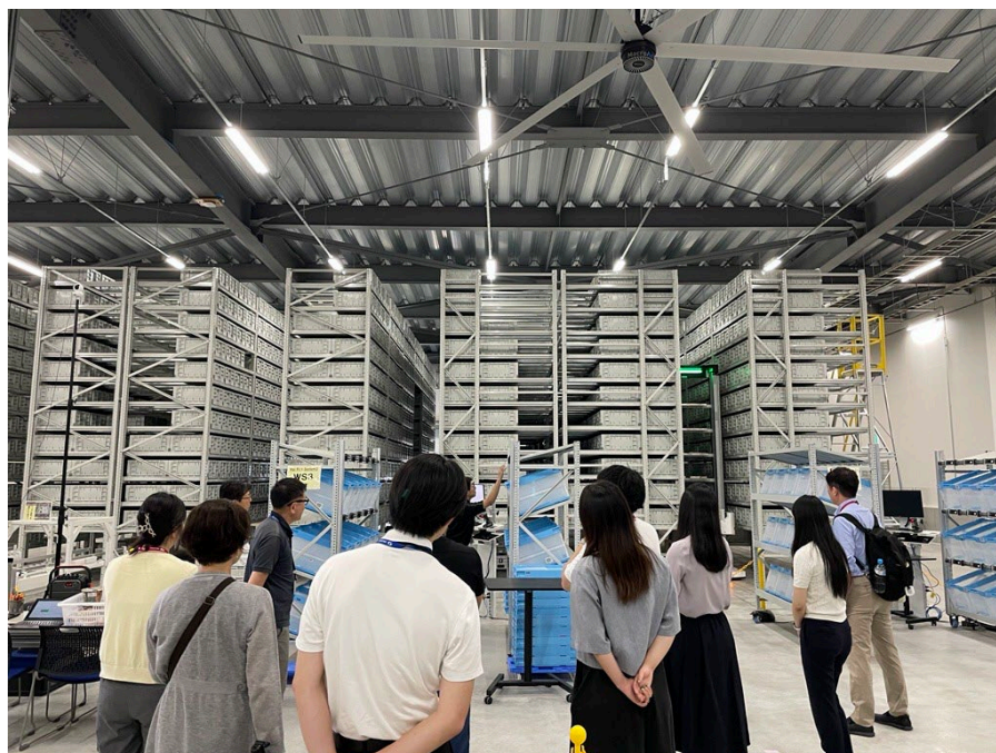
過去ツアーの様子

本ツアーでは、LTのプロフェッショナルである弊社LT企画部社員による解説のもと、業界先端のマテハン機器が実際に稼働する様子をご覧いただけるとともに、AutoStore（オートストア）を導入したオフィス通販向け大規模物流センターの現場もご見学いただけます。