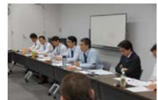
会議でも再発防止を徹底

当社トラックなど3台が関係する多重衝突事故が発生(死者2名、負傷1名)。再発防止・安全運行に向けての確認会議、緊急対策をグループ全体で実施