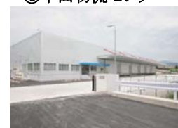
④千曲物流センター