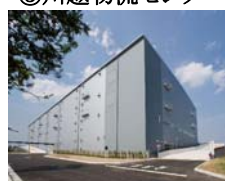
③川越物流センター